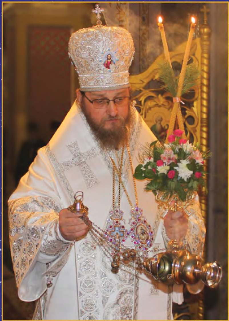
ВЫСОКОПРЕОСВЯЩЕННЕЙШИЙ НИКОДИМ АРХИЕПИСКОП СЕВЕРОДОНЕЦКИЙ И СТАРОБЕЛЬСКИЙ